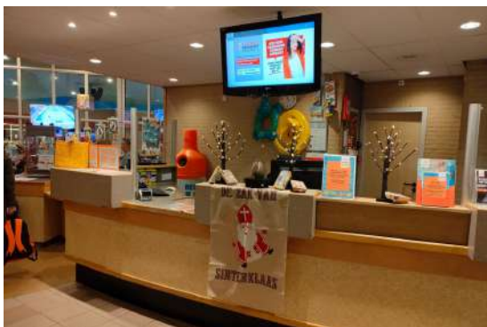
Gastenservice in zwembad De Hoorn

De gastenservice bevindt zich in zwembad De Hoorn en in zwembad AquaRijn bij de ingang. Bekijk de website voor de openingstijden van de gastenservice. Je kunt een betaalperiode op de lespas laten zetten door de gastenservice.