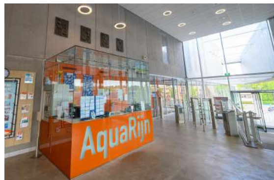
Gastenservice in zwembad AquaRijn